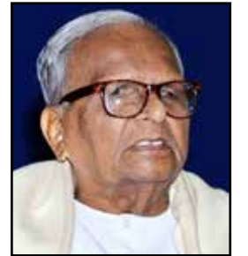
ಡಾ. ಪಾಟೀಲ ಪುಟ್ಟಪ್ಪ

1976ರಲ್ಲಿ ರಾಜ್ಯ ಪ್ರಶಸ್ತಿ, 1990ರಲ್ಲಿ ವಿಶ್ವೇಶ್ವರಯ್ಯ ಭಾರತ ಜ್ಯೋತಿ ಪ್ರಶಸ್ತಿ, 1999ರಲ್ಲಿ ಹುಬ್ಬಳ್ಳಿಯ ತಿಲಕ್ ಮೊಹರ ಪ್ರಶಸ್ತಿ, 1996 ರಲ್ಲಿ ಹಂಪಿ ವಿಶ್ವವಿದ್ಯಾಲಯದ ನಾಡೋಜ ಗೌರವ, 2001 ರಲ್ಲಿ ಕನ್ನಡ ಸಾಹಿತ್ಯ ಪರಿಷತ್ತಿನ ಗೌರವ ಸದಸ್ಯತ್ವ, 2002ರಲ್ಲಿ ಶಾಂತವೇರಿ ಗೋಪಾಲಗೌಡ ಪ್ರಶಸ್ತಿ, ಕನ್ನಡ ಸಾಹಿತ್ಯ ಪರಿಷತ್ತಿನ 'ನೃಪತುಂಗ' ಪ್ರಶಸ್ತಿ ಇತ್ಯಾದಿ ಲಭಿಸಿವೆ. ಬೆಳಗಾವಿಯಲ್ಲಿ ನಡೆದ 70ನೇ ಕನ್ನಡ ಸಾಹಿತ್ಯ ಸಮ್ಮೇಳನದ ಅಧ್ಯಕ್ಷ ಗೌರವ 2003 ರಲ್ಲಿ ದೊರೆಕಿತು.