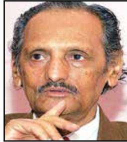
ಕೆ.ಎಸ್. ನಿಸಾರ್ ಅಹಮದ್