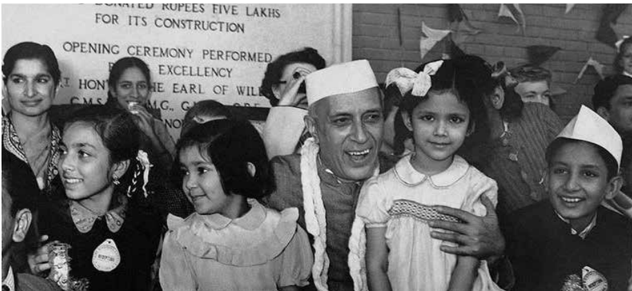
ಮಕ್ಕಳೊಂದಿಗೆ ಭಾರತದ ಪ್ರಥಮ ಪ್ರಧಾನಿ ಜವಾಹರಲಾಲ್ ನೆಹರೂ